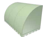
B303 Vertikal konvex*